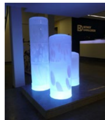
Ljusinstallation i Bengt Dahlgrenshuset i Mölndal.